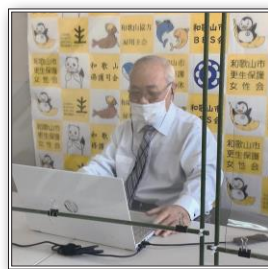
幸福の黄色いバックパネル

また、パソコンを操作することができる保護司に教わりながら、オンライン会議を行うようになりました。最初は分からないことだらけでしたが、最近は少しずつ慣れてきました。やればできるものです。画面越しの相手にわかりやすいよう、保護司会・更生保護女性会・BBS 会の名前が入った“幸福の黄色いバックパネル”を作成したり、みんなで知恵を出し合いながら頑張っています。