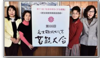
名士職域かくし芸芸能大会にて

A 毎年、“社会を明るくする運動”の一環として、当会主催で「名士職域かくし芸芸能大会」を実施しています。当日は、子供たちのミュージカルや日本太鼓演奏等の出し物で大いに賑わいます。保護観察所、保護司会、BBS会を始め、市内の多くの団体の御協力の下、開催することができ、人と人が繋がることの大切さを再認識することができる活動です。