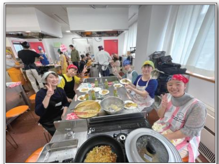
グループワークの一環でお好み焼き作りをする様子

A ともだち活動はもちろんですが、グループワークと自己研鑽に注力しています。ここ数年のグループワークでは、バーベキュー、横浜の街散策、ビーチボールバレー、お好み焼き作りを実施しました。グループワークに少年が参加してくれたことがきっかけで、ともだち活動が始まったケースもあり、継続的に少年と関わる機会を作り続けることが重要だと考えています。ともだち活動は、年間数名の少年を途切れることなく担当しており、毎月開催している定例会の中で進捗を報告し、会員や保護司の方から様々な角度でアドバイスをもらい、定例会が研鑽活動の場にもなっています。また、新たな活動として、神奈川県内の児童家庭支援センターへの訪問活動を開始し、地域に根ざした活動も行っています。