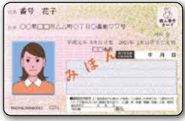
မျက်နှာစာဘက်