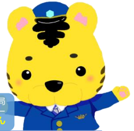
大阪出入国在留管理局 マスコットキャラクター えんトコくん

大阪出入国在留管理局は、国家公務員を志望される皆様に 出入国在留管理庁の業務を知っていただくため 『官庁公開フェスティバル2024』を開催します。 審査場見学等、入国審査官の魅力をお伝えできる内容となっています。 皆様の参加をお待ちしています！