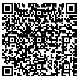
Mã QR về Văn phòng Hellowork

Ngoài ra, nếu bạn lo lắng về tư cách lưu trú của mình từ tháng 4, vui lòng trao đổi với Cục quản lý lưu trú xuất nhập cảnh gần bạn.