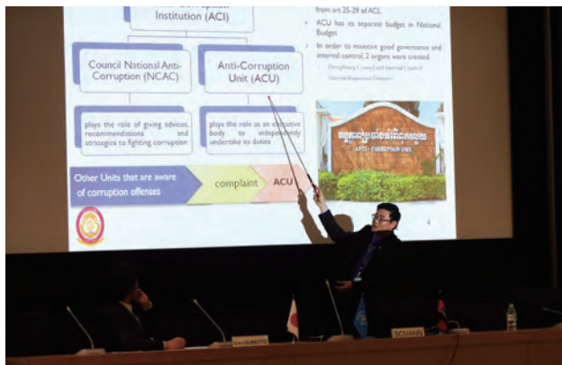
研修参加者による個人発表

アジ研は、2000年から汚職防止刑事司法支援研修を実施しています。5～6週間にわたり、参加国における汚職犯罪の現状及びこれに対する刑事司法の対応と課題を検討して明らかにするとともに、汚職犯罪対策上の課題に対し、国連腐敗防止条約（UNCAC）に定められた方策と照らし合わせながら、より効果的に対応できる刑事司法制度の在り方や、これを適正に運営するための具体的な方策を検討するもので、毎年約20名の外国人参加者及び約6名の日本人参加者を受け入れています。