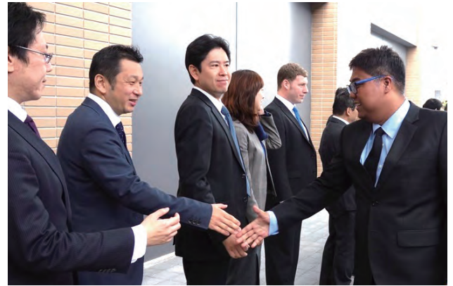
研修参加者の入所

アジア研は、国連犯罪防止・刑事司法プログラム・ネットワーク機関（PNI）の中でも最も長い歴史と実績を持つ機関として、UNODC及び他のPNIと緊密な連携を取りながら、国連の目指すグローバルな犯罪防止や犯罪者処遇に関する政策の立案・実施に協力し政策の立案・実施に協力し、持続可能な開発目標（SDGs）の推進に努めています。