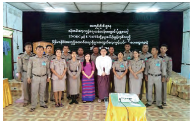
ミャンマー一行刑職員現地セミナー