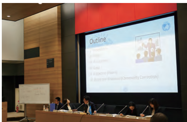
アジ研教官による講義