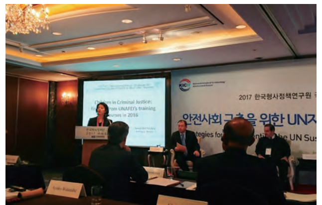
PNI ミーティング（韓国）