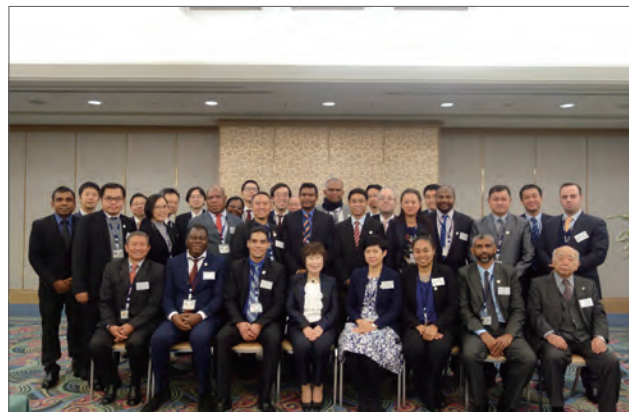
アジア刑政財団広島支部主催交流会

また、保護司アジア研協力会等多くのボランティアの方々からも、研修参加者を対象とするホームヴィジットや茶道体験など、研修参加者が幅広く日本文化に接する機会を提供していただいています。