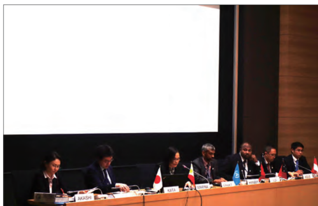
全体討議における研修参加者発表