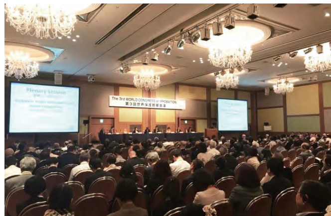
第3回世界保護観察会議（日本）