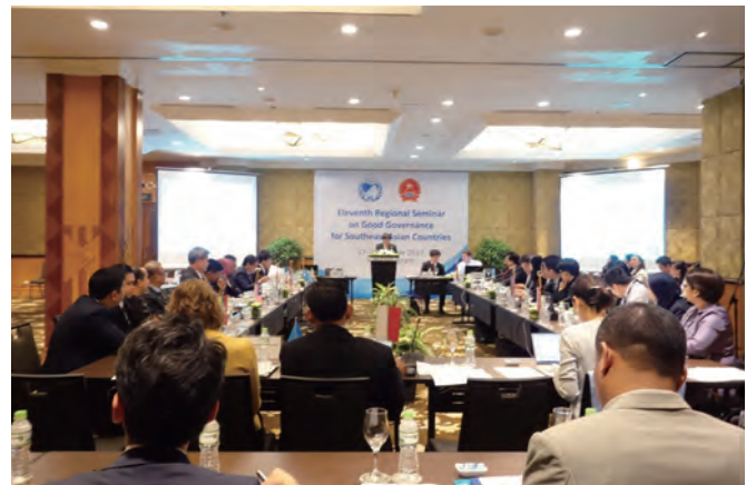
第11回セミナー（ベトナム）