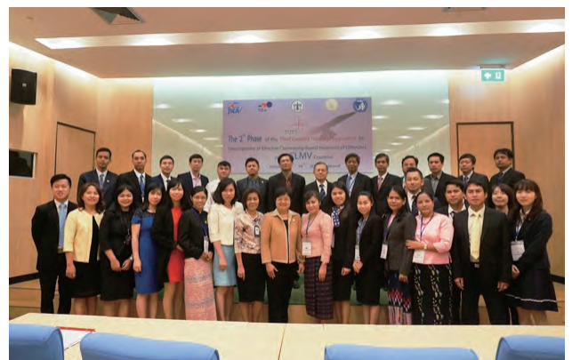
CLMV 諸国における社会内処遇推進研修