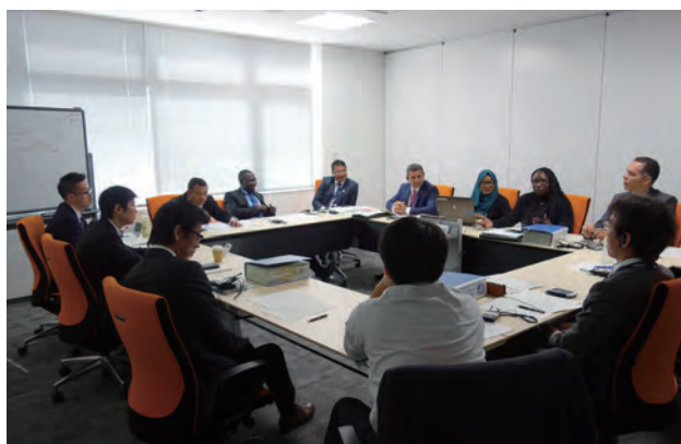
グループワークショップ