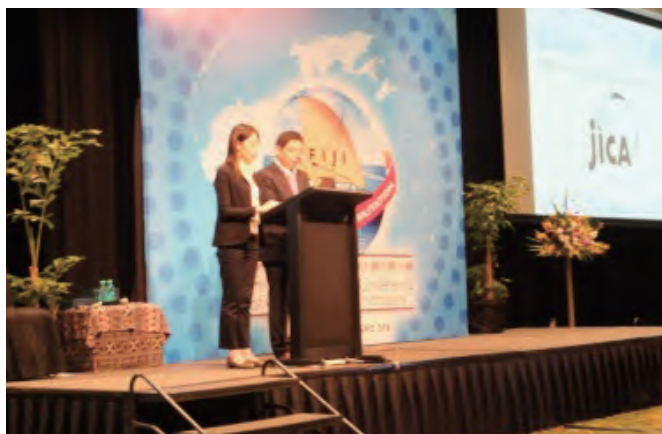
アジア太平洋矯正局長等会議（フィジー）

アジ研は、国連テロ対策委員会、国際汚職対策機関協会総会、アジア太平洋矯正局長等会議、現代刑事司法国際フォーラム、国際矯正刑事施設協会総会、世界保護観察会議などの国際会議に職員を派遣し、講演や発表を行うなど、刑事司法の発展のため、様々な国際協力活動に積極的に参加しています。