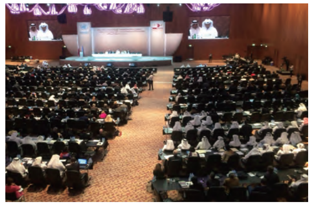
第13回コンGRESS（カタール）