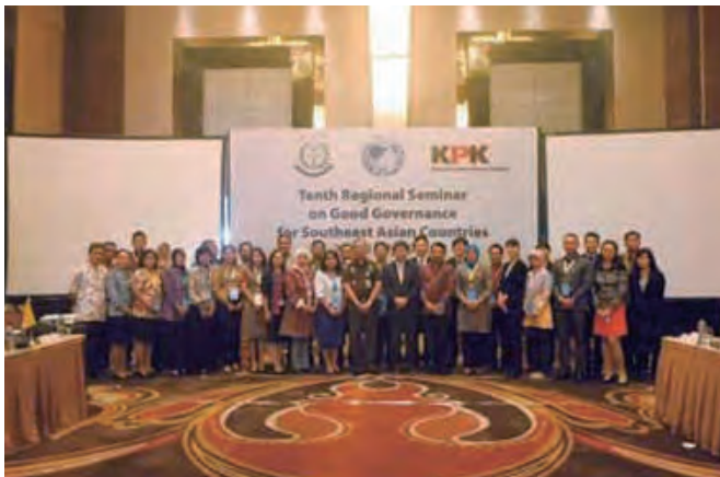
第10回セミナー（インドネシア）

セミナーの開催国は、2年ごとに変え、2018年までにタイ、フィリピン、マレーシア、インドネシア、ベトナム及び日本で開催しました。2019年は、日本（東京）で開催しました。いずれのセミナーにも、東南アジア諸国から、汚職対策に携わる職員の参加がありました。