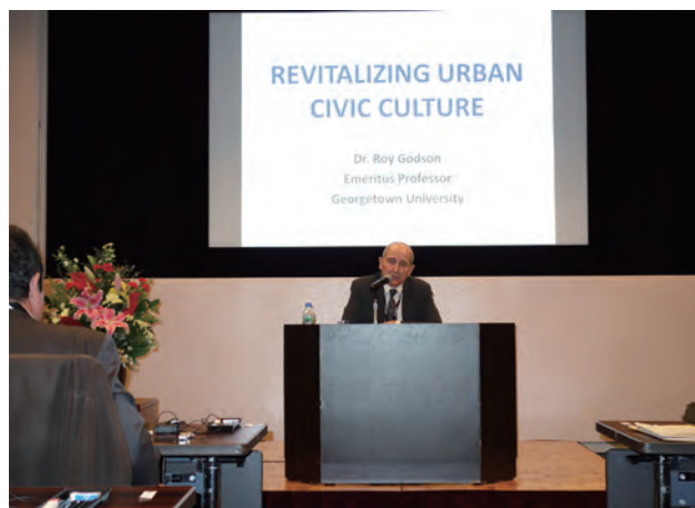
刑事政策公開講演会

日本刑事政策研究会、ACPF との共催により、毎年 1 回、法務省において、アジ研が招へいた海外からの客員専門家による講演会を開催しています。