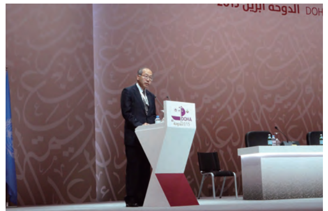
大野検事総長（当時）による2020年コンGRESS日本招致のステートメント（2015年4月、カタール）

次回、2020年に京都で開催される第14回コンGRESSにおいても、アジア研は、再犯防止をテーマとするワークショップの企画・運営をします。