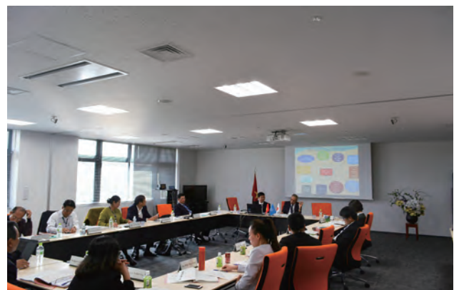
ベトナム法整備支援研修