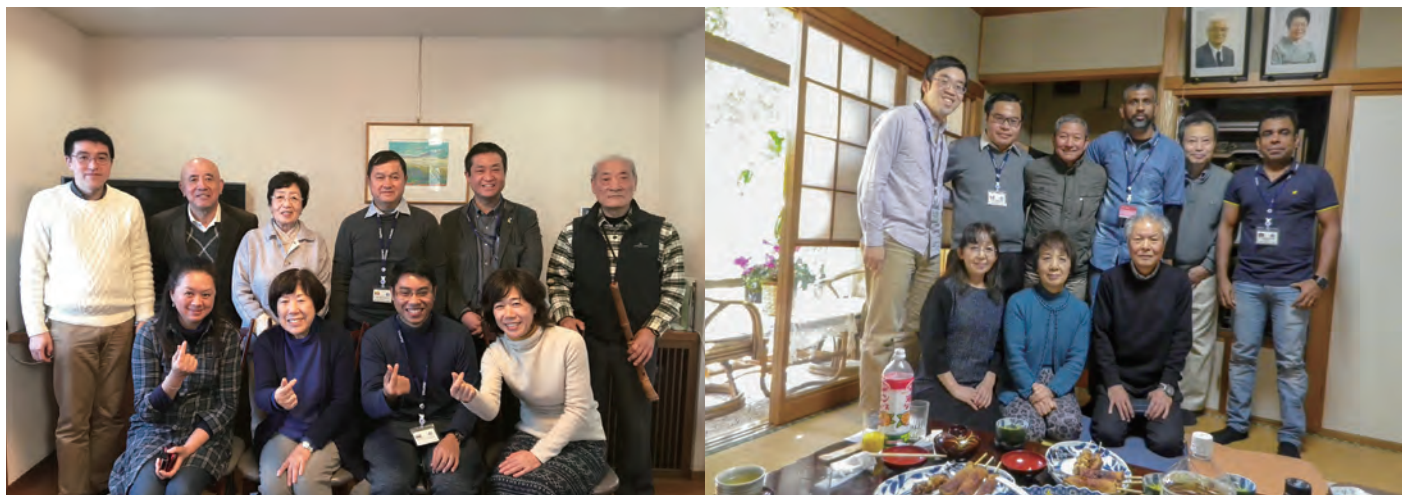
ホームヴィジット（研修参加者が保護司のお宅を訪問）