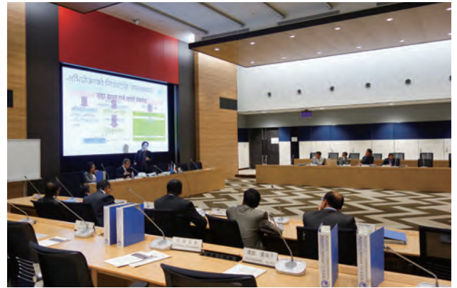
日本・ネパール司法制度比較共同研究

2017年から、タイ法務省保護局が主催するCLMV諸国（カンボジア、ラオス、ミャンマー、ベトナム）における社会内処遇推進のための研修に協力しています。