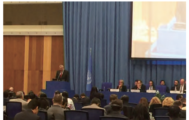
コミッション（オーストリア）