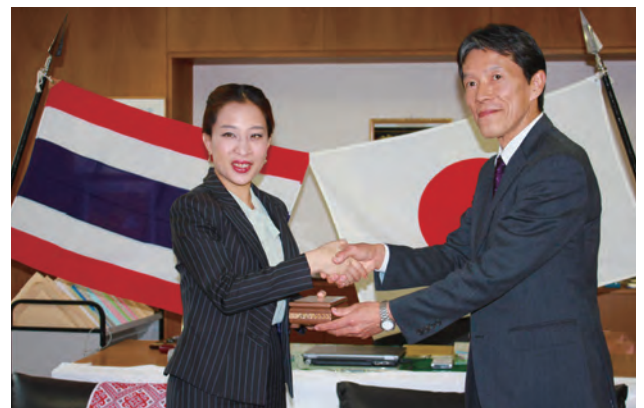
タイ王国パッチャラキティヤパー王女殿下訪問