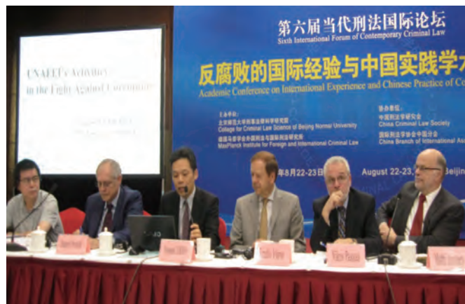
第6回現代刑事法国際フォーラム（中国）