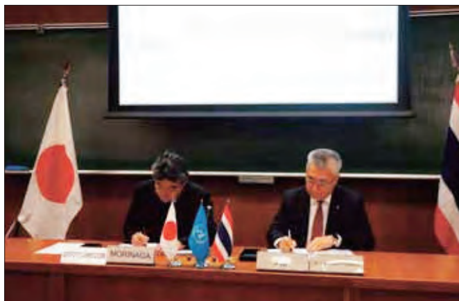
タイ法務研究所とのMOU締結